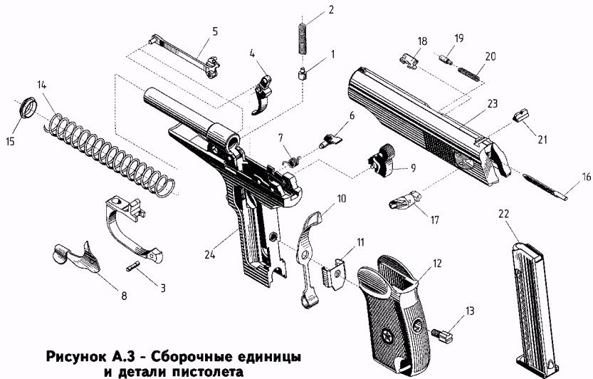
Рисунок А.3 - Сборочные единицы и детали пистолета