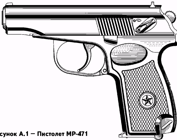
Рисунок А.1 – Пистолет МР-471